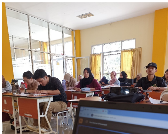
Gambar 1. Penyampaian materi

Pelatihan proses penulisan karya ilmiah pada hari pertama dimulai dengan pemaparan materi secara teori yang memberikan pemahaman mendalam tentang struktur dan pedoman penulisan skripsi, termasuk aturan-aturan yang harus diikuti dalam menulis karya ilmiah. Setelah pemaparan teori, sesi praktik dilaksanakan dengan melibatkan peserta secara langsung untuk mempraktikkan apa yang telah dipelajari, mulai dari penyusunan proposal hingga penulisan pendahuluan.