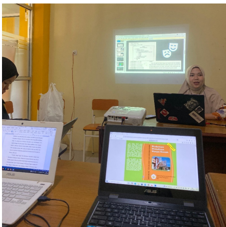
Gambar 2. Pengaplikasian materi kedalam tulisan

Pelatihan penulisan karya ilmiah pada hari kedua difokuskan untuk menginternalisasi dan mengimplementasikan materi yang telah dipelajari pada hari pertama dengan cara langsung menerapkannya pada contoh penelitian yang telah diberikan sebelumnya.