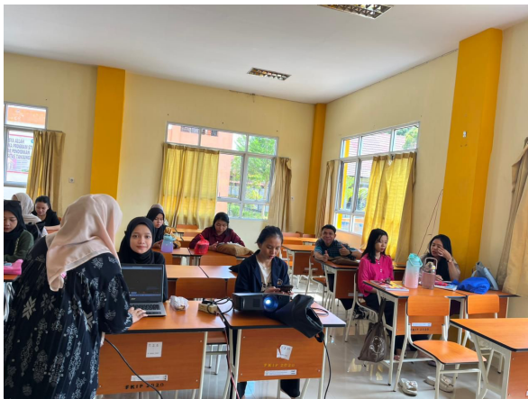
Gambar 3. Dosen memeriksa hasil kerja mahasiswa

Dengan demikian, pelatihan ini tidak hanya memperkuat konsep yang telah dipelajari, tetapi juga memberikan pengalaman langsung dalam mengembangkan dan menyempurnakan karya ilmiah mereka.